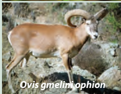
Ovis gmelini orhion